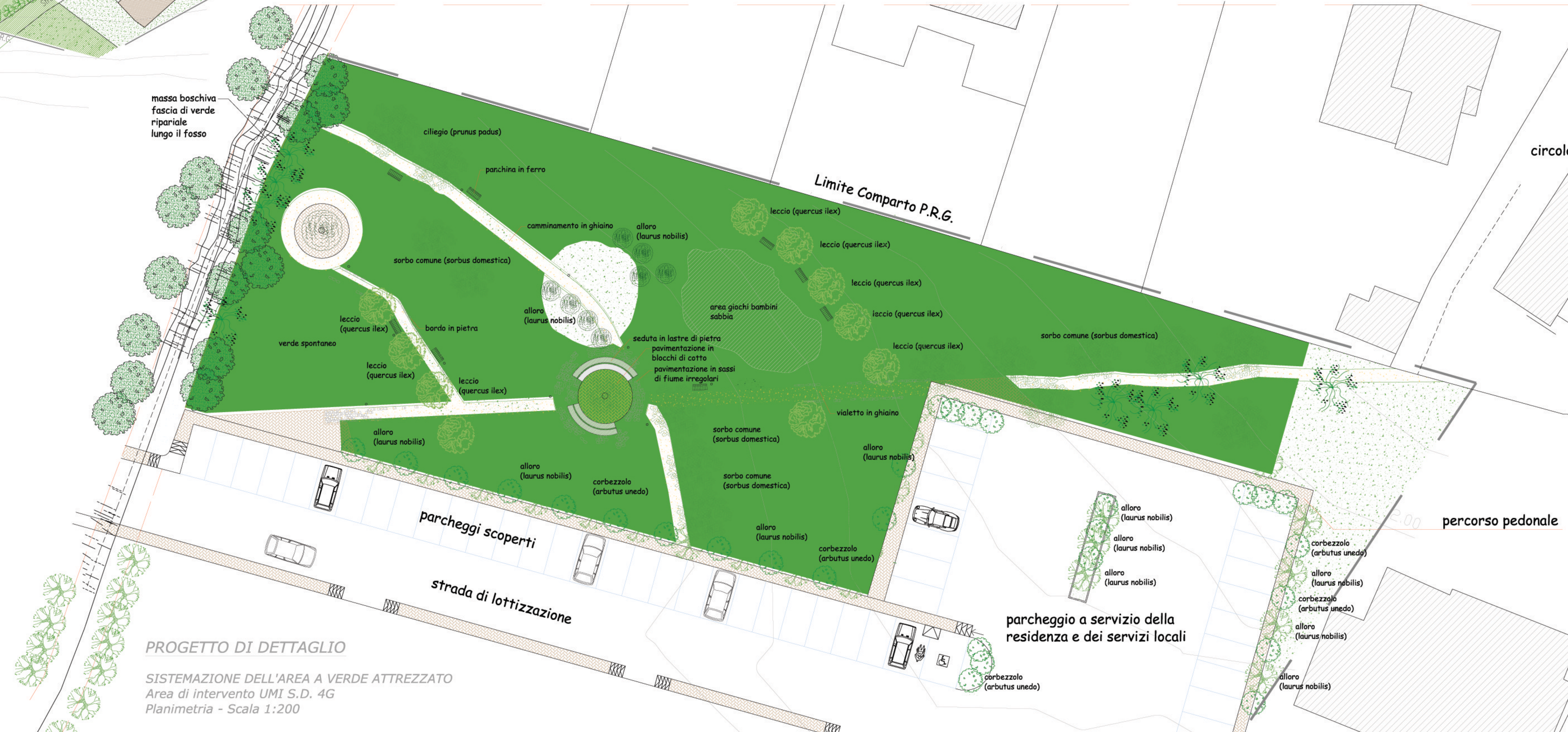
PROGETTO DI DETTAGLIO

la posizione della fascia permeabile alberata, posizionata tra i lotti privati edificabili ed il limite fisico dell'area lottizzata, tende a ricoprire un ruolo di cucitura tra spazi verdi privati lottizzati e il verde agricolo a valle.