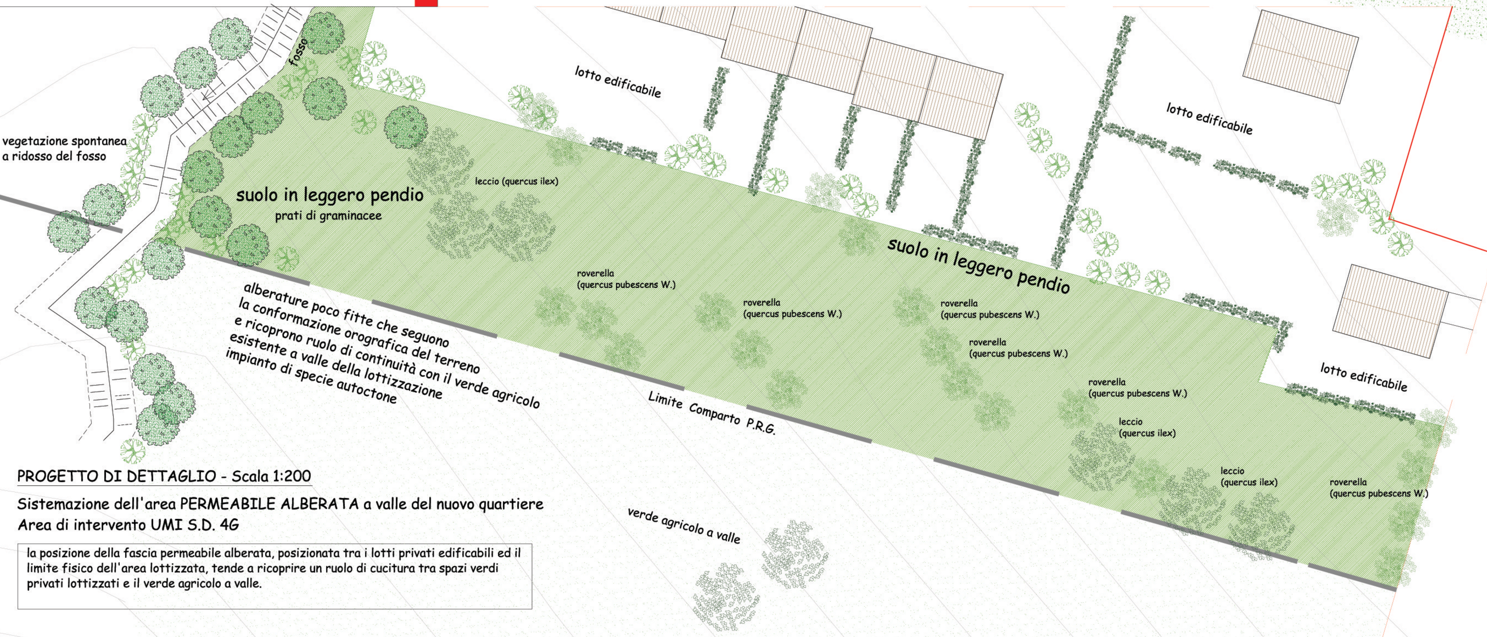
PROGETTO DI DETTAGLIO - Scala 1:200

Sistemazione dell'area PERMEABILE ALBERATA a valle del nuovo quartiere Area di intervento UMI S.D. 4G