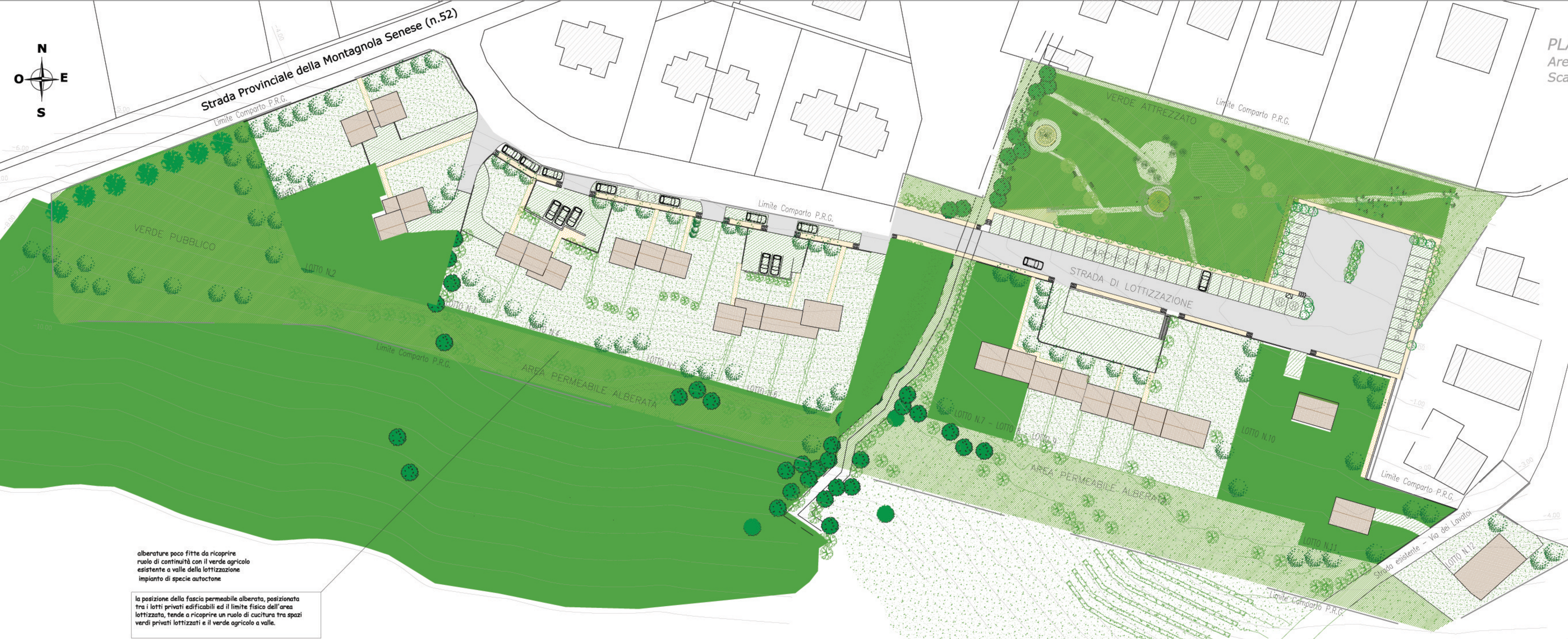
PLANIMETRIA DELLE SISTEMAZIONI ESTERNE Area di intervento UMI S.D. 4G Scala 1:500